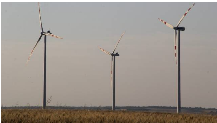
Vier Windkraftanlagen sind im Wald auf der „Ried Linaberg“ geplant.